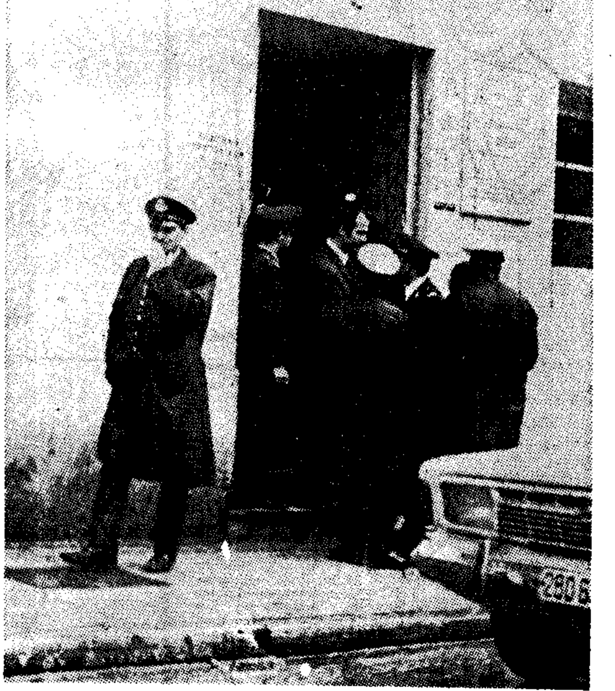
Η είσοδος των δικαστηρίων της οδού 'Αρακάη. Και εδώ αωστήρά αστυνομικά μέτρα.

Το Ε.Μ.Π. θα είναι ο χώρος της συγκεντρωτικής φοιτητών Νομικής και Φιλοσοφικής Σχολής του Πολυτεχνείου 'Αθηνών και Σίνα κτήριο της Νομικής Σχολής. Η εισαγγελία προέβλεπε την άθωωση όλων των κατηγορουμένων, πλην ενός, ο οποίος θα ήταν ενοχός για την περιβριση της Αρχής. Η εισαγγελία προέβλεπε την άθωωση των κατηγορουμένων για όλες τις κατηγορίες, εκτός από την εισβολή στο Ε.Μ.Π. Η εισαγγελία προέβλεπε την άθωωση των κατηγορουμένων για όλες τις κατηγορίες, εκτός από την εισβολή στο Ε.Μ.Π.